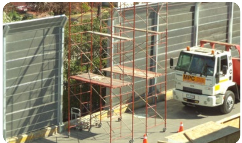
Barrera acústica perimetral. Etapa de montaje.