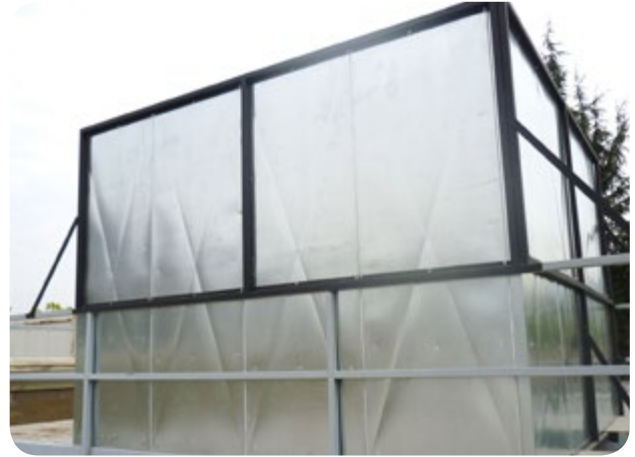
Vista exterior del apantallamiento acústico de central de frío en supermercado.