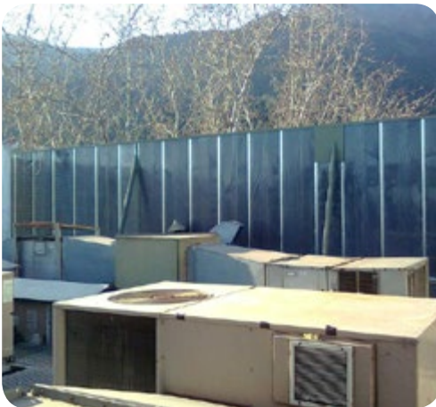
Barrera acústica en equipos de climatización azotea edificio corporativo.