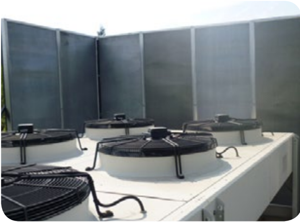
Apantallamiento acústico de central de frío. Barrera acústica local equipos condensadores en supermercado.