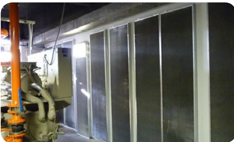
Sala de máquinas equipos chillers. Los paneles metálicos montados como fonoabsorbente son de gran utilidad para reducir la reverberación de la sala.