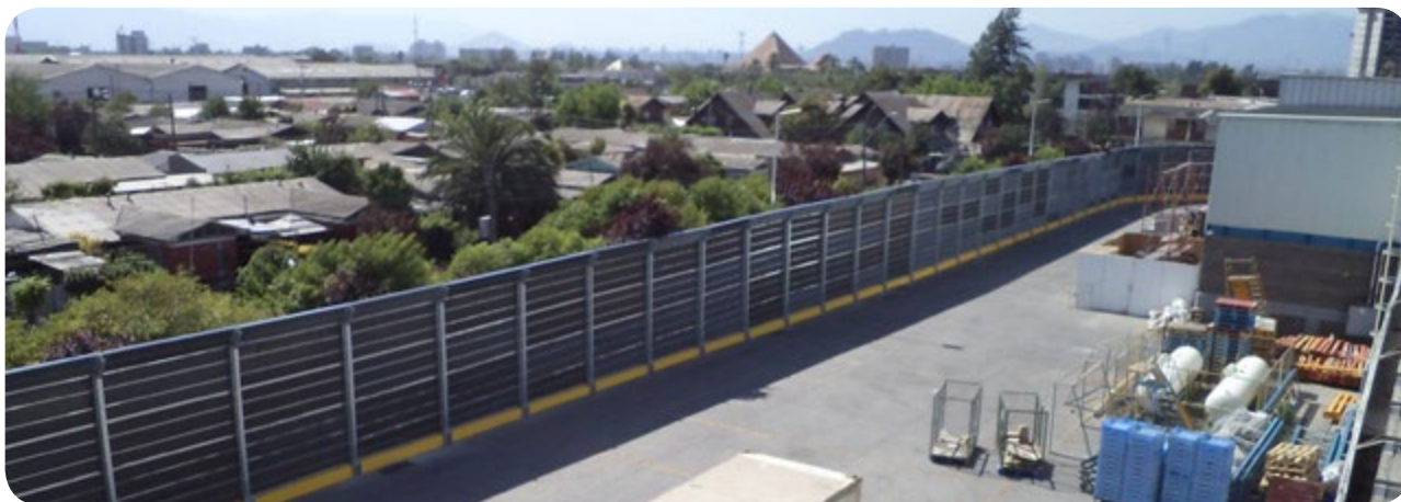
Barrera acústica instalada en supermercado.

Las barreras acústicas panel modular PMA (Metálico) fabricadas por Cibel, tienen la función de interponer un obstáculo a la propagación sonora entre una fuente y un receptor.