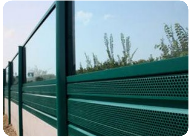
Carreteras y autopistas. Este producto no crea sombras indeseadas, no bloquea vistas panorámicas y no daña la estética del lugar.