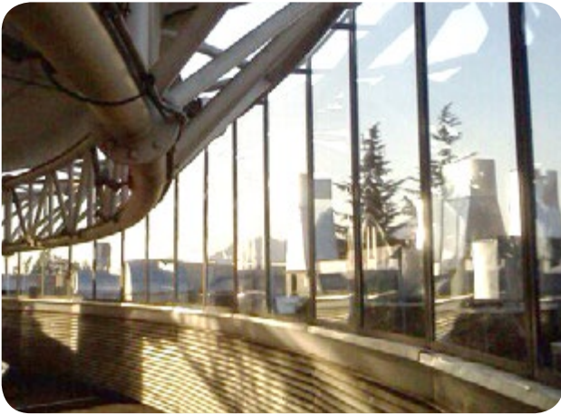
Centros comerciales. En estos lugares se solucionan los problemas de emisión de ruido que afectan a las personas y a la vez se consigue un resultado estético.