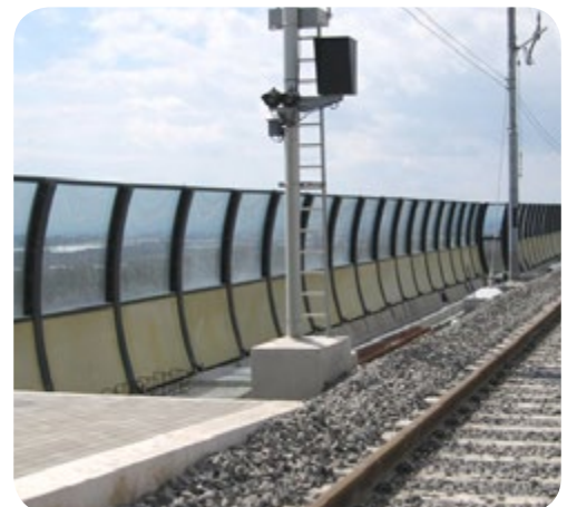
Lineas ferroviarias. El uso de paneles es imprescindible para la seguridad y la calidad de vida de las localidades contiguas.