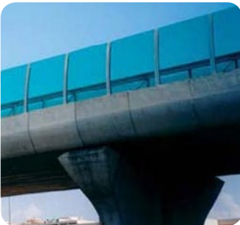
Pasarelas. Más seguridad y comodidad para las personas.