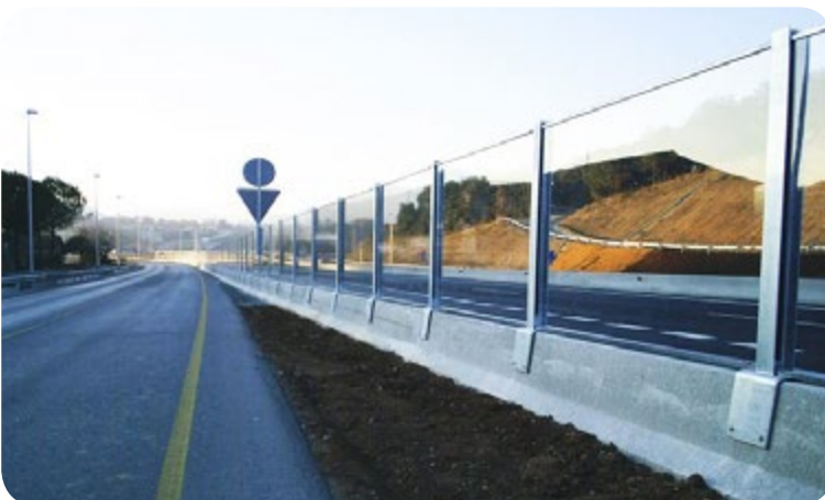
Carreteras y autopistas. Facilitan el ingreso de luz. De la misma manera, se puede mantener la vista de un paisaje y la orientación de los conductores cuando la instalación es a baja altura.